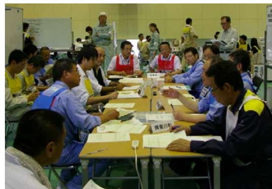
平成 29 年度 合同防災訓練実施状況