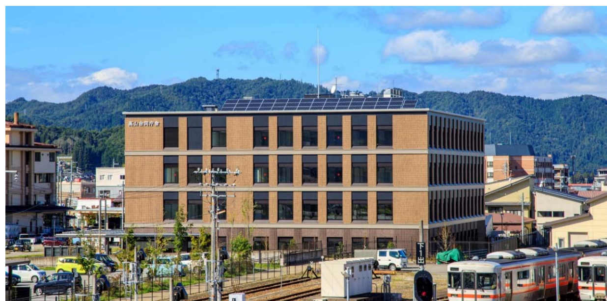
庁舎 (高山駅から望む)