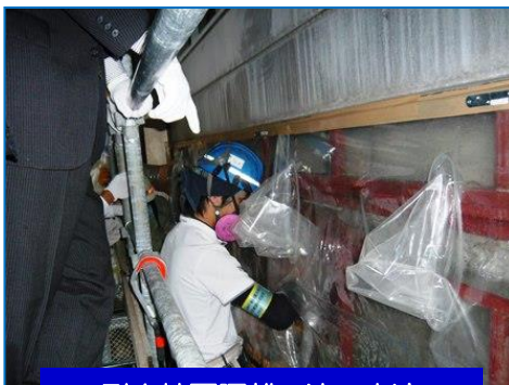
耐火被覆隔離工法の実演