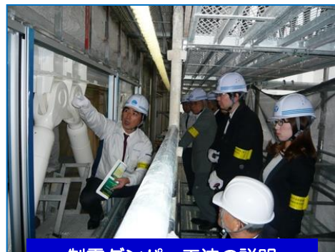
制震ダンパー工法の説明