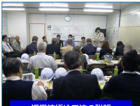
採用技術や工法の説明