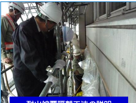
耐火被覆隔離工法の説明