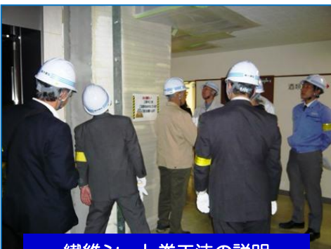
繊維シート巻工法の説明