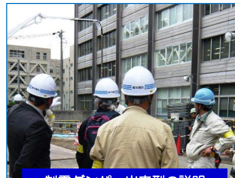
制震ダンパー出来型の説明