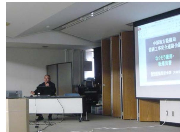
愛知労働局 安全専門官 講義