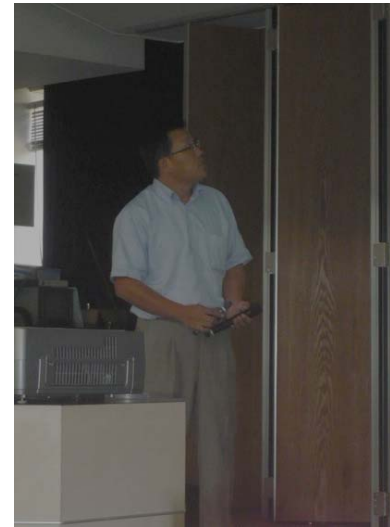
(株)竹中工務店 事例発表