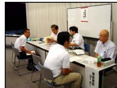
保全相談(愛知会場)