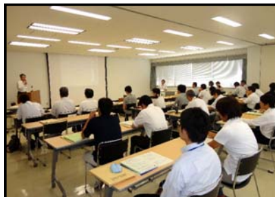
会議の状況(岐阜会場)