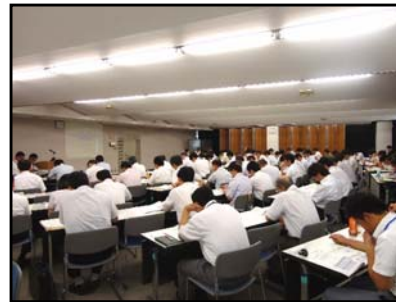
会議の状況(愛知会場)