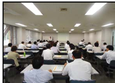
会議の状況(三重会場)