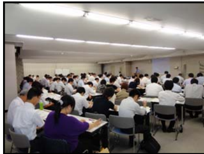
会議の状況(愛知会場)