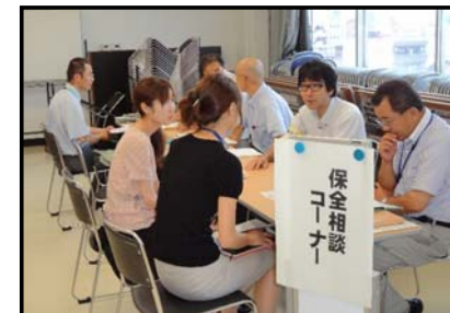
保全相談(岐阜会場)