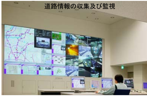
道路情報の収集及び監視