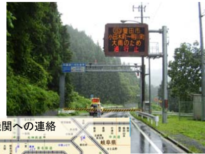
関係機関への連絡