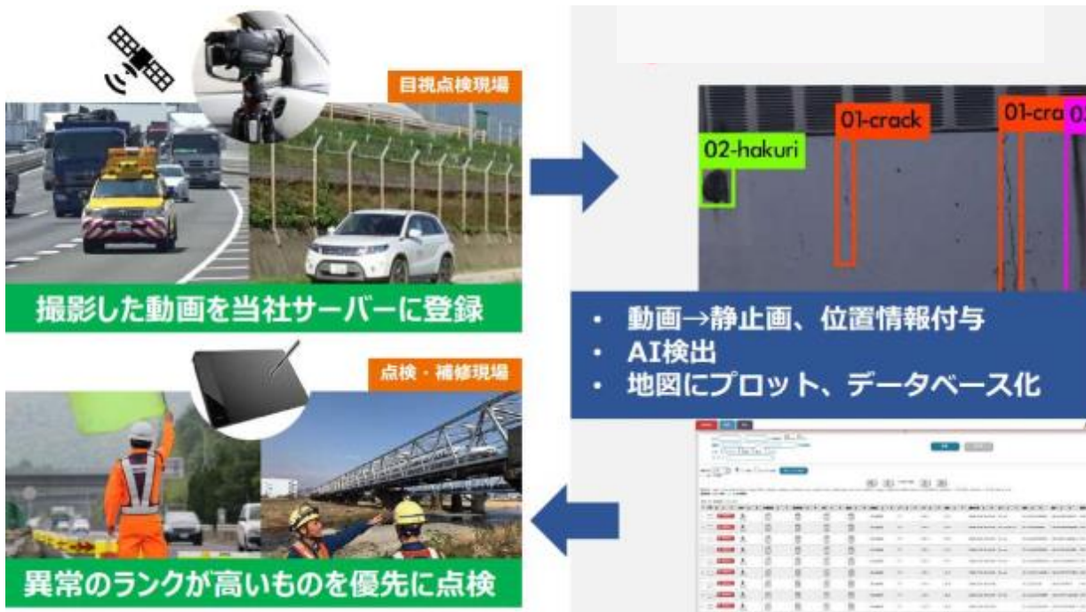
省力化支援フロー