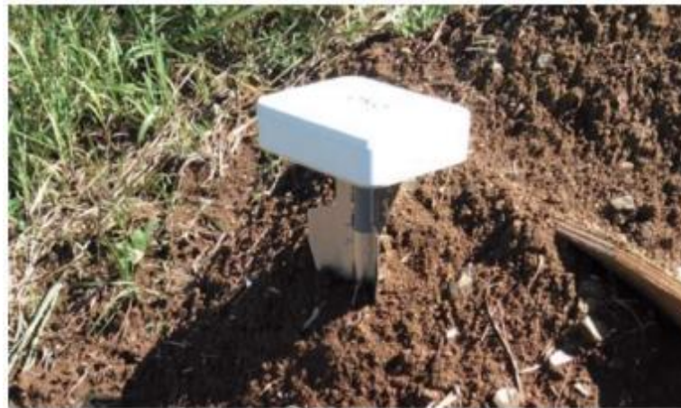
クリノポール設置イメージ