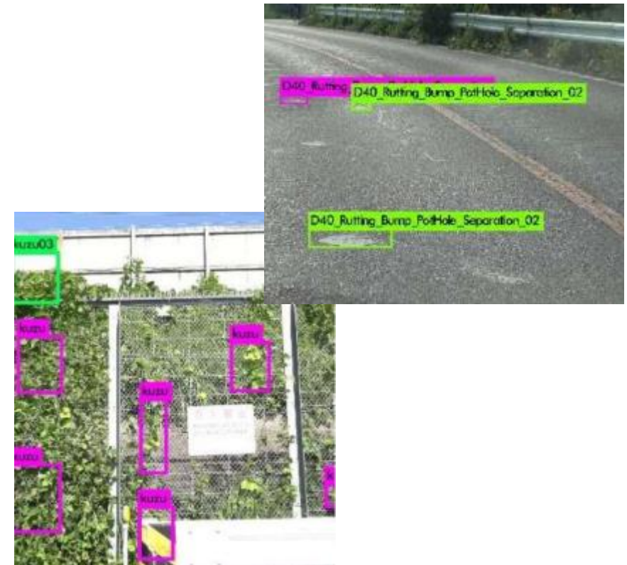
異常事象検出 イメージ