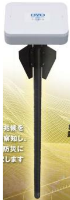
クリノポール 外観