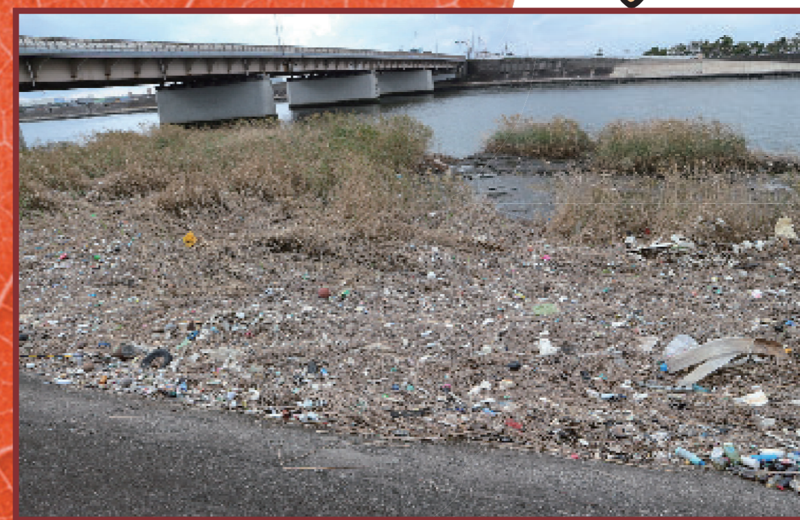
ますますゴミが増える