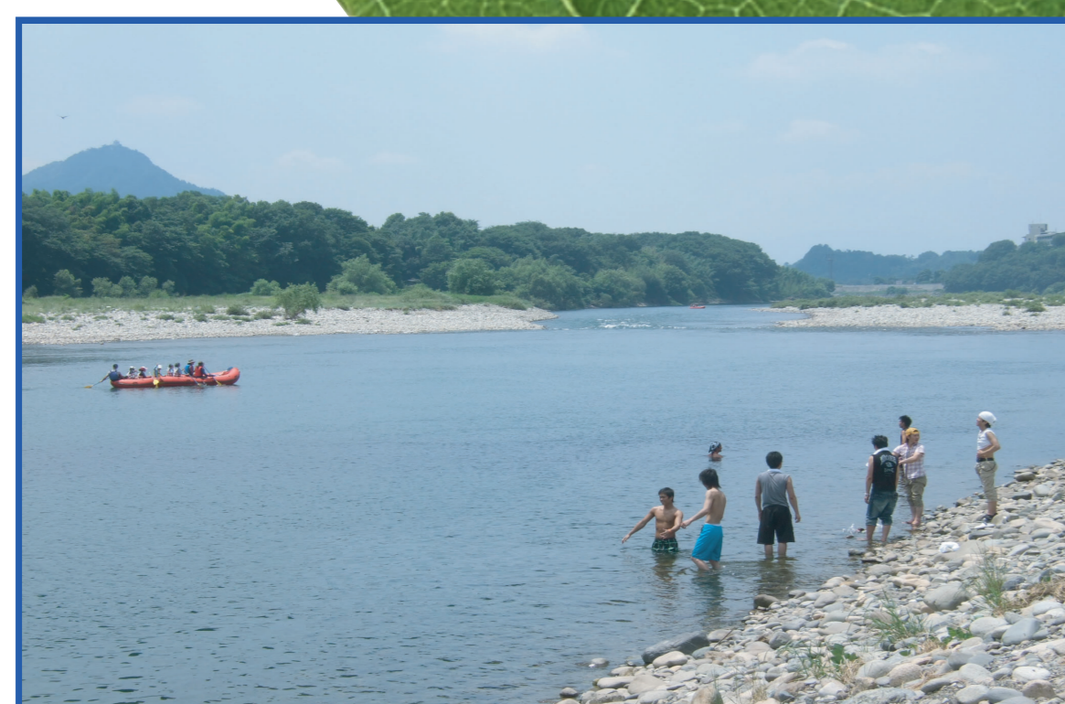
いつでもきれいな水辺