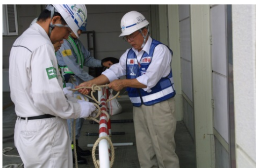
災害協定業者対象