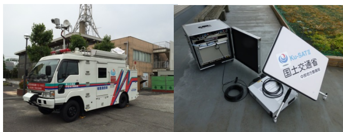
国土交通省職員対象

Ku-SATの設置方法及び操作方法を説明します。実際に衛星回線を利用して映像送信を実施します。