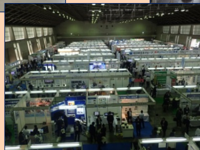
「国土交通省の特定建設技術開発の取り組み」展示

国土交通省が掲げる「生産性革命」の目玉「 i-Construction 」をはじめ、近年の主要課題である「 インフラマネジメント 」や「 危機管理・防災 」を紹介。また当日、「 NETIS相談コーナー 」を開設。