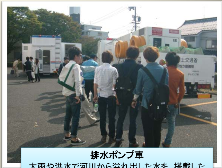
排水ポンプ車 大雨や洪水で河川から溢れ出した水を、搭載したポンプで排出します(DSシステム搭載)