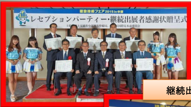
継続出展者感謝状贈呈式