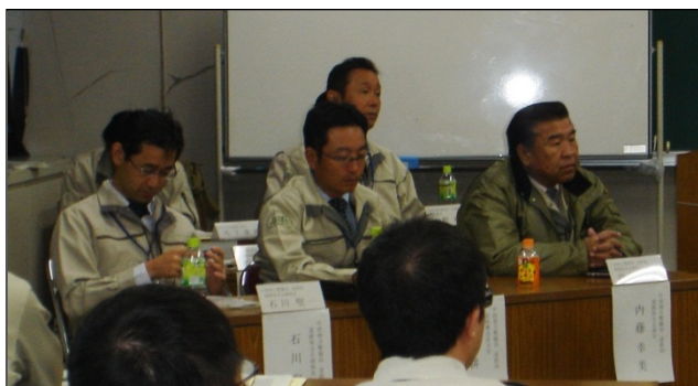
【座学】 中部地整の講師