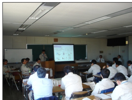
熱心に受講する参加者