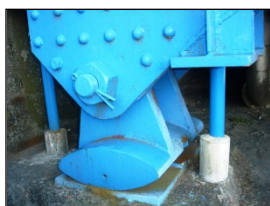
珍しいロッカー支承