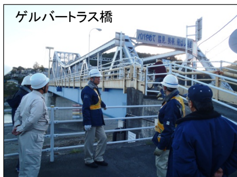
【現地研修】 側面より全体、通りを見ましょう