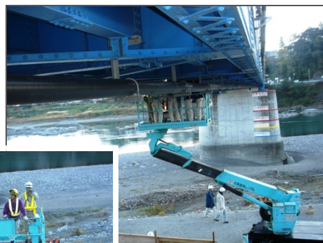
リフト車で桁下の点検床版の状況は？ 点検ハンマーで確認