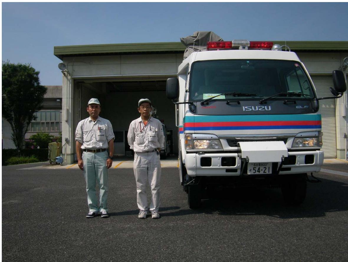
(中部技術事務所 衛星通信車 出動状況写真)