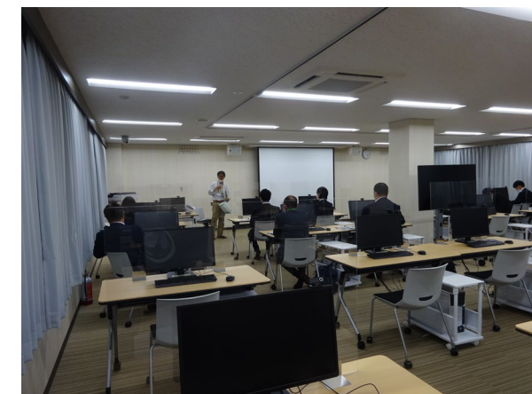
最後に質疑応答 たくさんの質問ありがとうございました