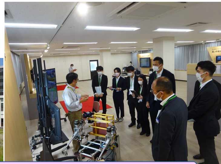
建設機械の遠隔操縦についての説明とカメラモニターを介した操縦体験