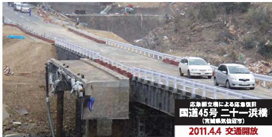
応急組立橋による応急復旧 国道45号 二十一浜橋 (宮城県気仙沼市) 2011.4.4 交通開放