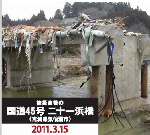
震災直後の 国道45号 二十一浜橋 (宮城県気仙沼市) 2011.3.15

応急復旧が早かった理由には、震災直後から建設業者が作業に入ったこと、復旧対策に現地での作業方法の検討を活かし、応急組立橋の設置など技術的に工夫できたことなどがある。