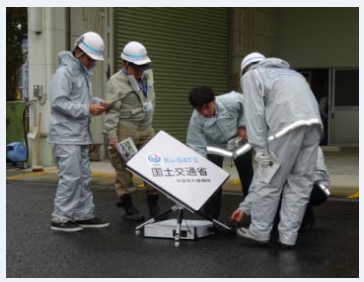
Ku-SAT II 訓練