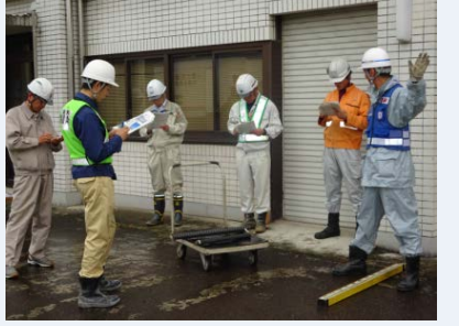
ロープワーク・目測訓練