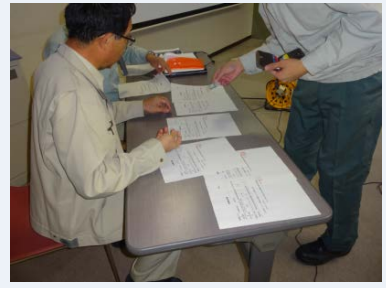
訓練終了後継続学習制度 (CPDS)受講証明書の発行