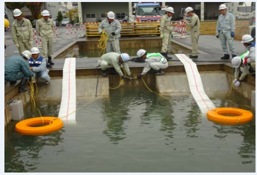
排水ポンプ車設置操作訓練