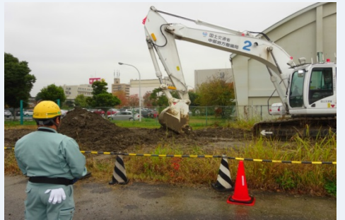
「運転技能講習修了証」保有者の無人化 施工バックホウの遠隔操作重点訓練