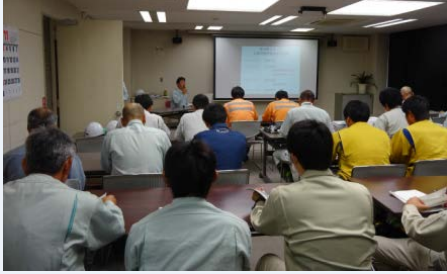
災害対策用機械の概要・ 操作方法等基礎知識の習得

平成27年11月17日・18日、中部技術事務所構内で災害対策用機械(排水ポンプ車、照明車、無人化施工バックホウ)の操作訓練、ロープワーク・目測訓練、衛星通信車・Ku-SAT II 訓練(国交省職員)を実施しました。