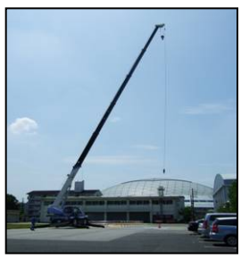
構内での操作訓練