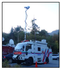
平成26年度 御岳噴火で活動