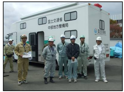
平成22年度 東日本大震災で活動