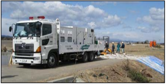
平成22年度 東日本大震災(仙台空港)で活動