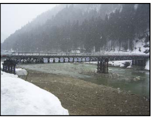
平成16年度 岐阜県飛騨市における応急架設