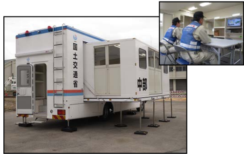
構内での操作訓練