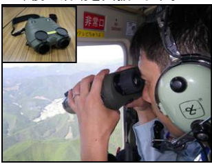
平成23年度 台風12号の被災状況調査