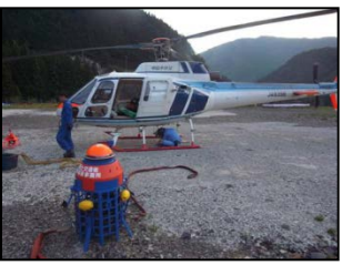
平成23年度 奈良県十津川村天然ダムにおいて活動