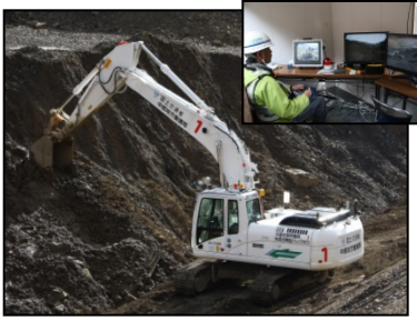
平成25年度 奈良県五條市の土砂崩落現場で活動