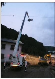
平成22年度 岐阜市八百津町土砂崩れで活動