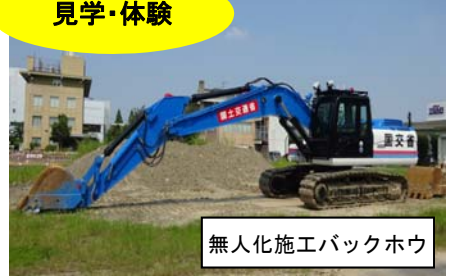
無人化施工バックホウ

立ち入り禁止となっている災害復旧現場での作業を行うため、遠隔操作による作業を可能にした土砂掘削機械