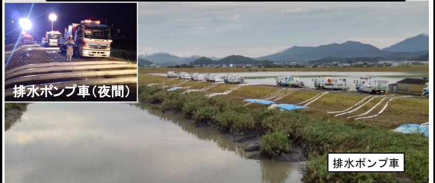
排水ポンプ車(夜間)

令和元年8月の前線に伴う大雨【令和元年度】 佐賀県大町町での排水ポンプ車による排水作業