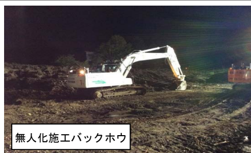
無人化施工バックホウ