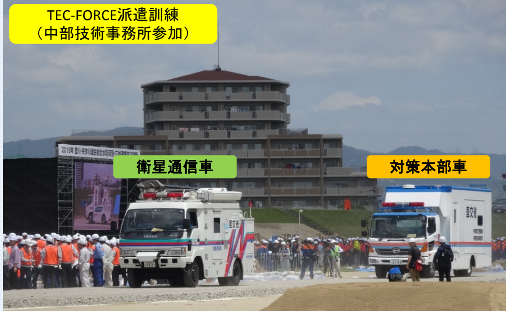
TEC-FORCE派遣訓練 (中部技術事務所参加)