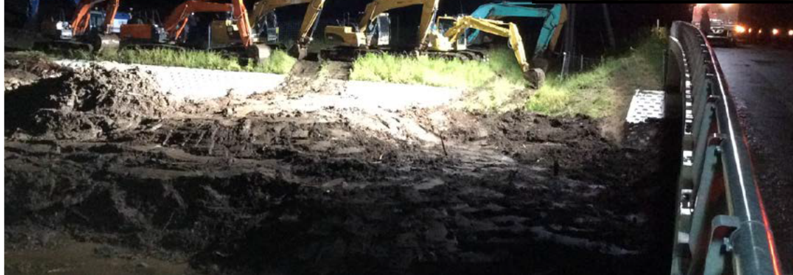
北海道勇払郡厚真町 夜間照明・土砂掘削状況