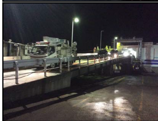
フェリーを利用して災害対策用機械を北海道へ輸送