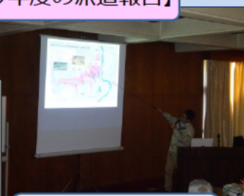
平成30年7月豪雨 （岡山県）