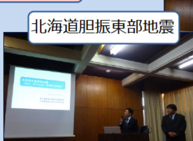
北海道胆振東部地震