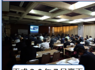
平成30年7月豪雨 （岡山県）