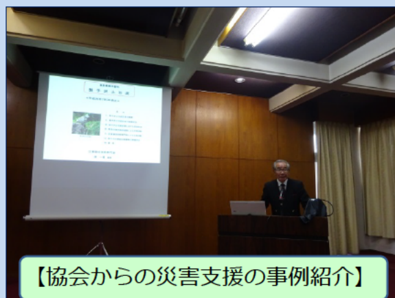
【協会からの災害支援の事例紹介】

協定締結後、初開催の意見交換会に 協会及び会員企業から52名の方が 参加されました。