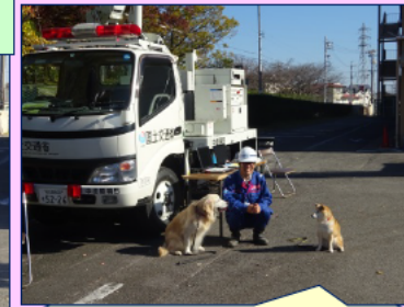
災害は飼い犬にとっても “他人事”ではありません

中部技術事務所は、愛知県内の自治体が主催する防災訓練への参加を通じて、防災活動の連携確認や地域住民の方への啓発活動に取り組んでいます。