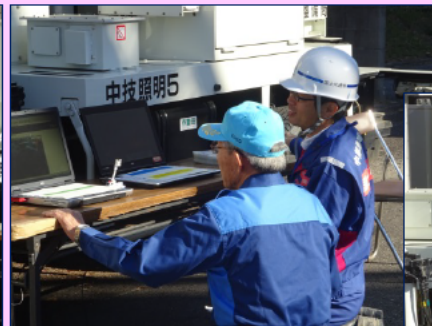
手には照明車のトミカ！！