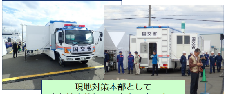
現地対策本部として 中部地方整備局長と鳥羽市長とで テレビ会議を実施