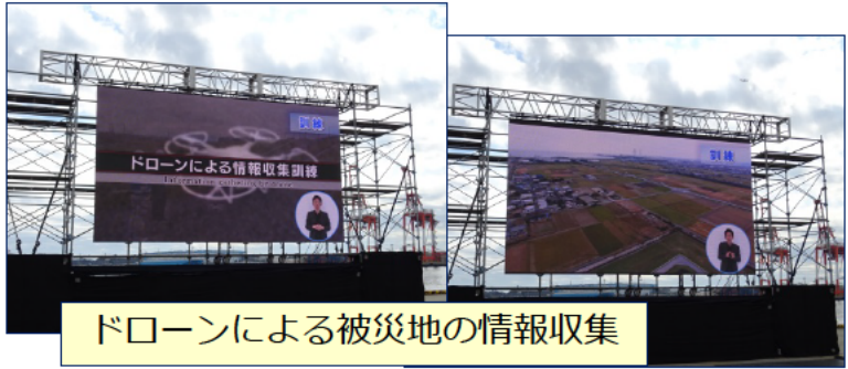
ドローンによる被災地の情報収集