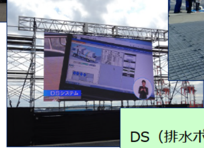
排水作業実演 DS（排水ポンプ車状態監視）システム紹介