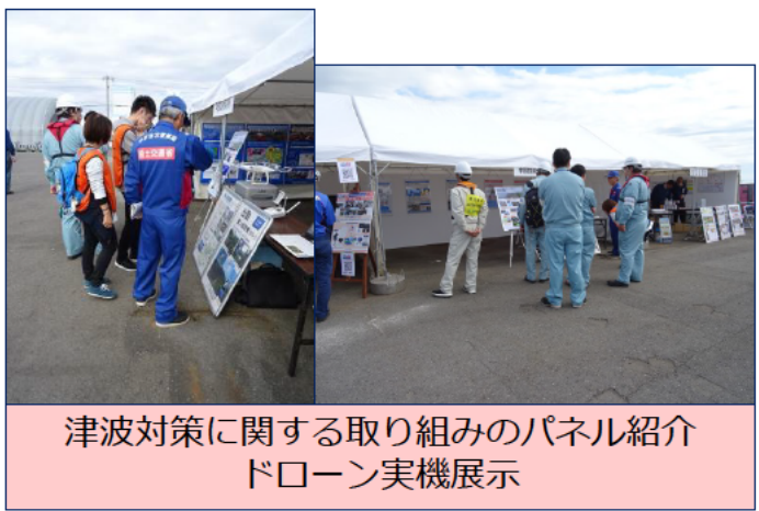
津波対策に関する取り組みのパネル紹介 ドローン実機展示