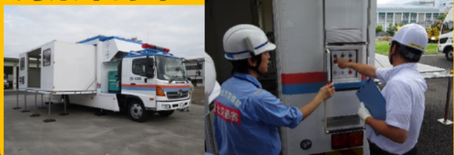
車体拡幅時 操作体験

【問合せ先】 中部技術事務所 総務課 電話：052-723-5701 【アクセス】 地下鉄名城線「ナゴヤドーム前矢田駅」下車1番出口より徒歩1分