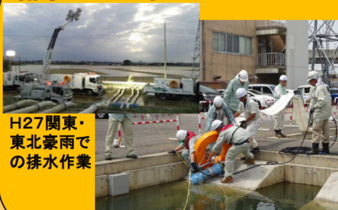
H27関東・東北豪雨での排水作業 操作体験