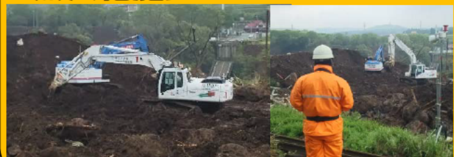
H28熊本地震での作業状況 遠隔操縦状況