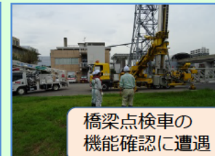
橋梁点検車の 機能確認に遭遇