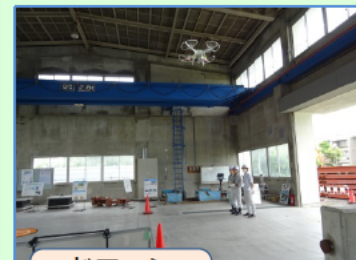
ドローン 操作体験