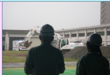
無人化施工バックホウ操作体験