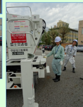
照明車の アウトリガー設置中