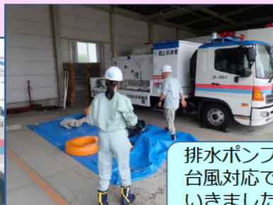
排水ポンプ車はまさにこの後、 台風対応で実際に派遣されて いきました。