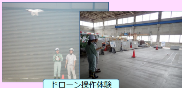
ドローン操作体験