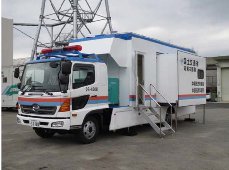
対策本部車（拡幅型）