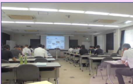
「中部地方整備局ってどんなところ??」 の説明の後、屋外へ・・・

平成30年7月15日、暑い中、国家公務員を志望される受験生及びそのご家族22名が説明会に参加され、災害支援活動をはじめ中部地方整備局の仕事内容や生活などを紹介しました。