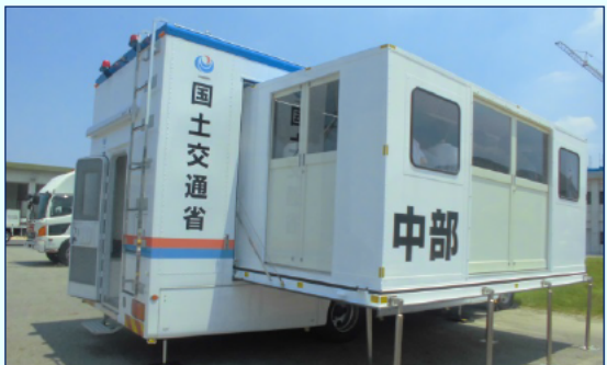
いざという時の前線基地となる 対策本部車