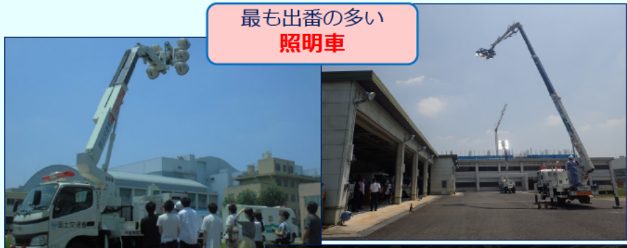
最も出番の多い 照明車