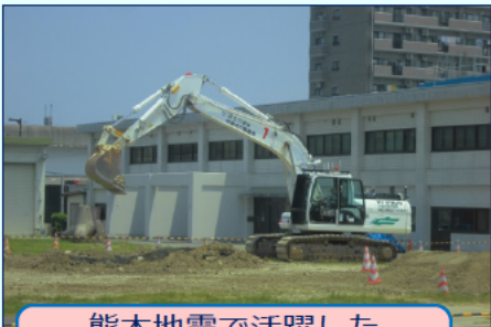
熊本地震で活躍した 無人化施工バックホウ