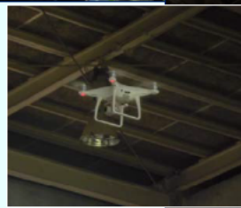
今後の活用が期待される ドローン