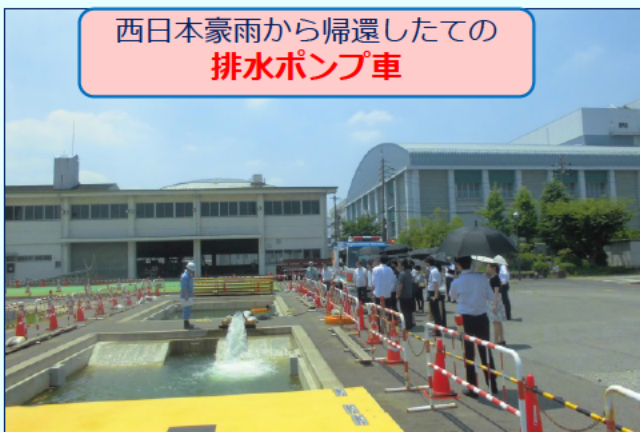
西日本豪雨から帰還したでの 排水ポンプ車