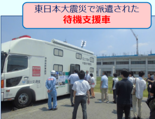
東日本大震災で派遣された 待機支援車