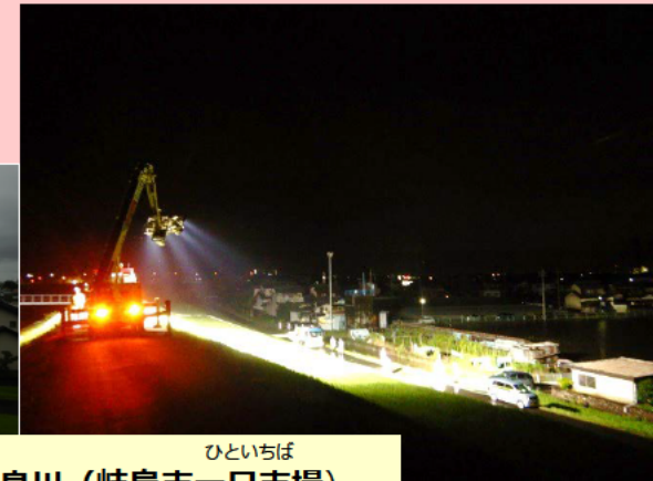
ひといちば 伊自良川（岐阜市一日市場）

この他にも、 照明車1台（10m級） を 国道156号（美濃市曾代）の 土砂崩れ復旧作業支援に、 また、 衛星通信車1台 を 国道41号数河峠の災害対応支援に派遣しました。