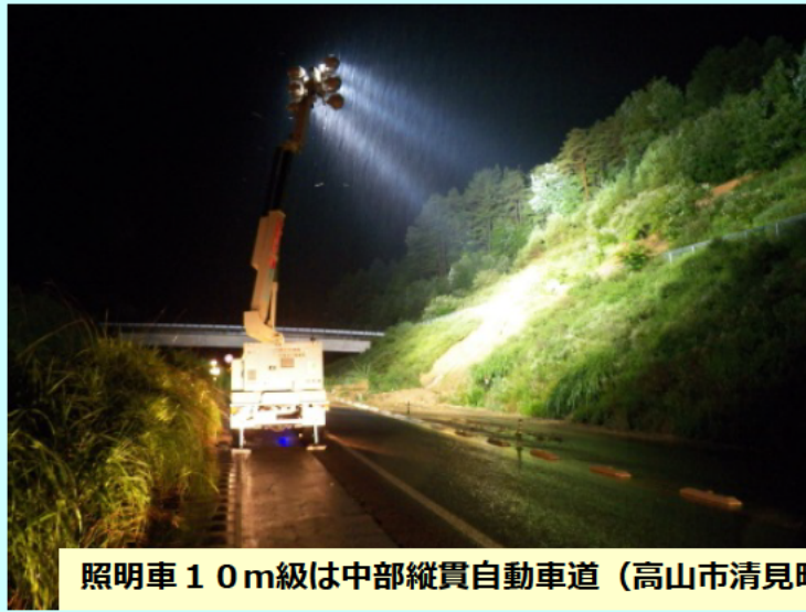
照明車10m級は中部縦貫自動車道（高山市清見町）にて活躍

岐阜県の雨がいかにも大変であるか一目瞭然。 降水量が 観測史上最大 を記録する地点も。 (気象庁HPより)