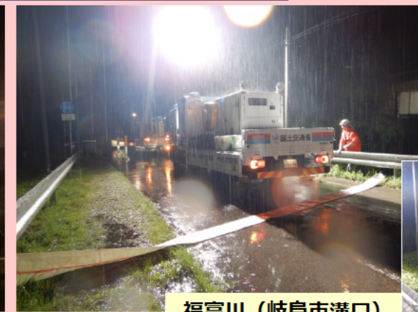
福富川（岐阜市溝口）