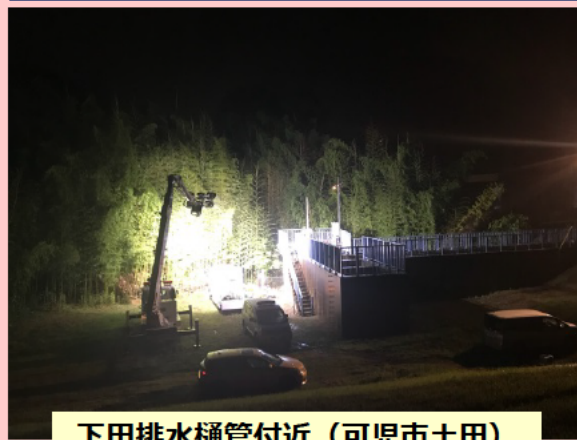
下田排水樋管付近（可児市土田）

排水支援のため岐阜市2カ所、可児市1カ所へ 排水ポンプ車1台（30m 3 /分）・照明車1台（20m級） を派遣。