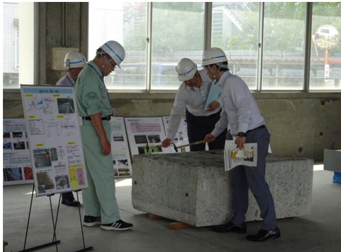
コンクリート部材の打音検査体験