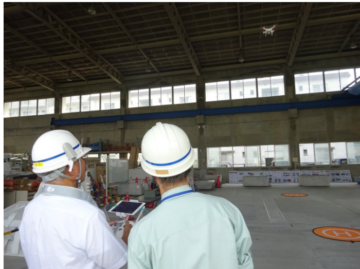
ドローンの操作体験