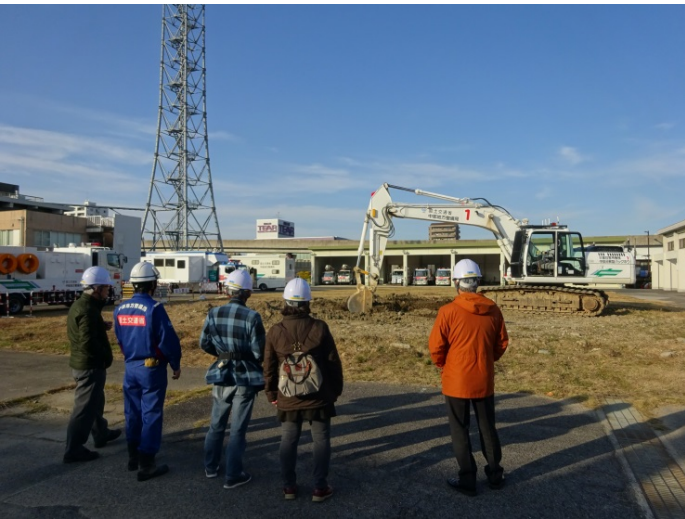
遠隔操作ショベルの操作体験