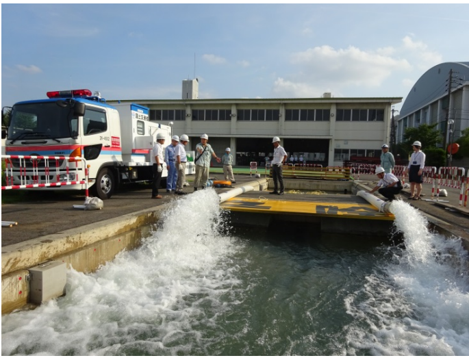
排水ポンプ車の操作体験