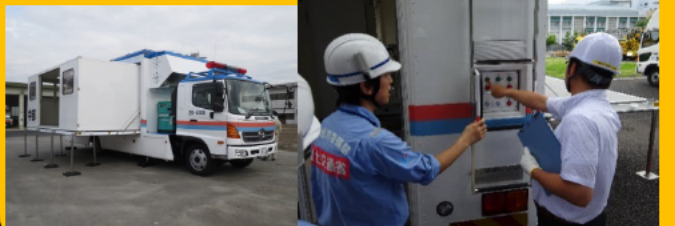
車体拡幅時 操作体験

【問合せ先】 中部技術事務所 総務課 電話：052-723-5701 【アクセス】 地下鉄名城線「ナゴヤドーム前矢田駅」下車1番出口より徒歩1分