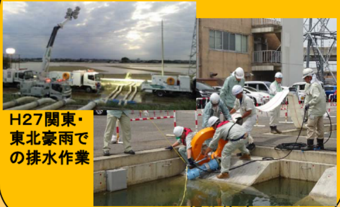
H27関東・東北豪雨での排水作業 操作体験