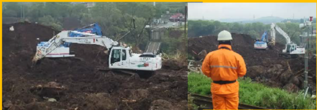
H28熊本地震での作業状況 遠隔操縦状況