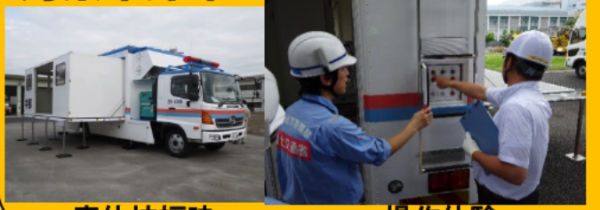
車体拡幅時 操作体験

【問合せ先】 中部技術事務所 総務課 電話：052-723-5701 【アクセス】 地下鉄名城線「ナゴヤドーム前矢田駅」下車1番出口より徒歩1分