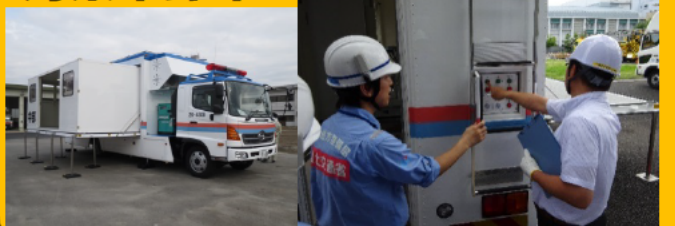
車体拡幅時 操作体験

【問合せ先】 中部技術事務所 総務課 電話：052-723-5701 【アクセス】 地下鉄名城線「ナゴヤドーム前矢田駅」下車1番出口より徒歩1分