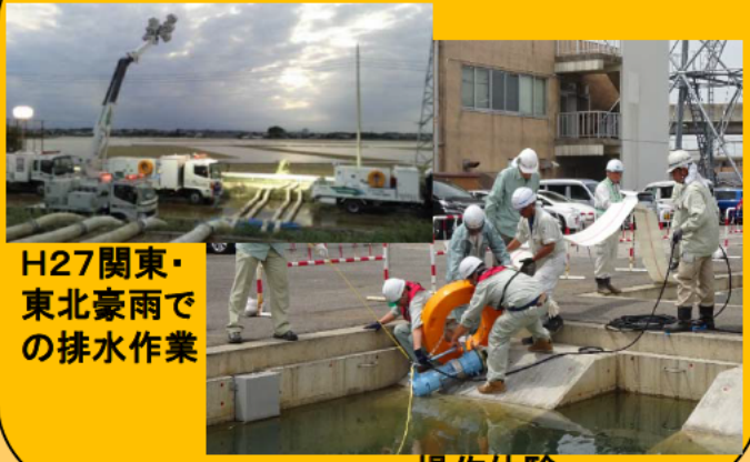
H27関東・東北豪雨での排水作業 操作体験