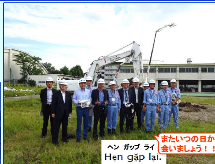
ヘン ガ ヱッ ライ Hẹn gặp lại.