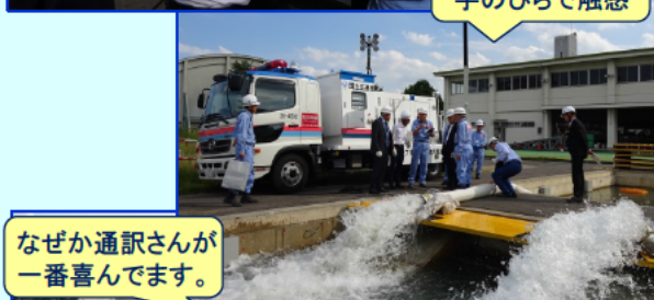
排水の圧力を手のひらで触感