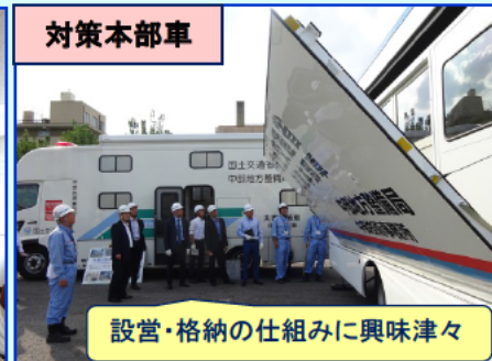
設営・格納の仕組みに興味津々