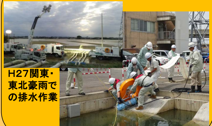
H27関東・東北豪雨での排水作業