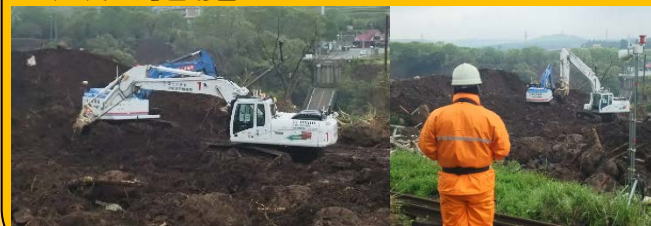
H28熊本地震での作業状況 遠隔操縦状況