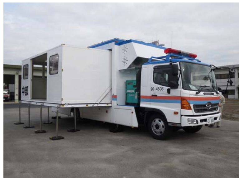
対策室設置時(拡幅後)