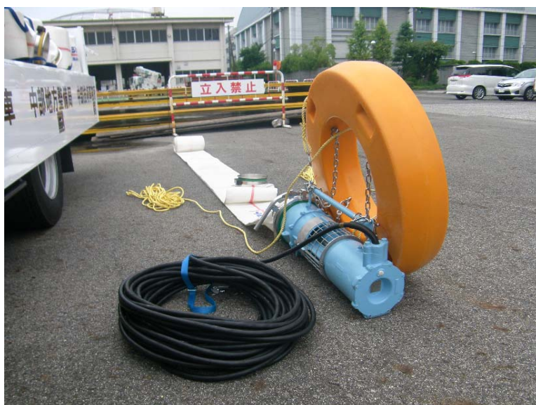
排水ポンプ (Φ200mm 7.5m 3 /min×4台 全揚程10m)