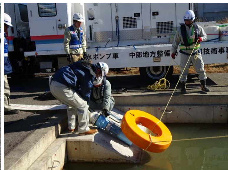
人力で設置・撤去可能