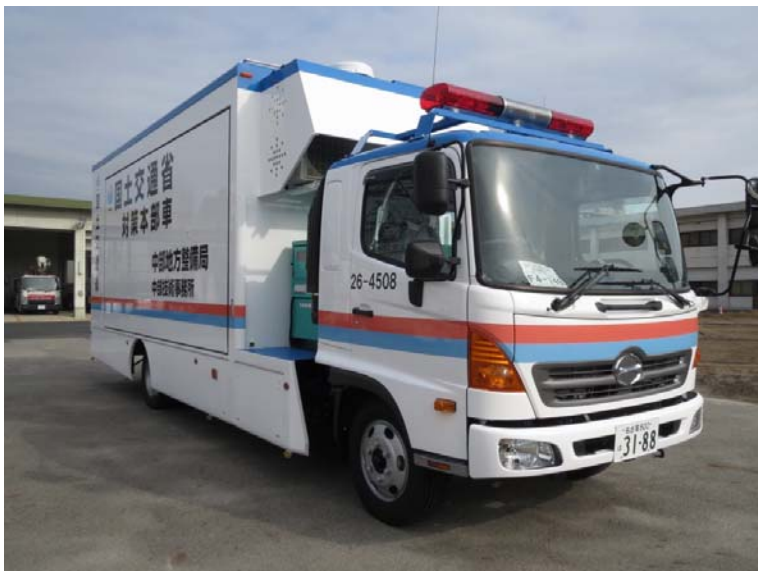
車両移動時(拡幅前)