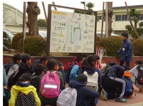
職員による施設の説明