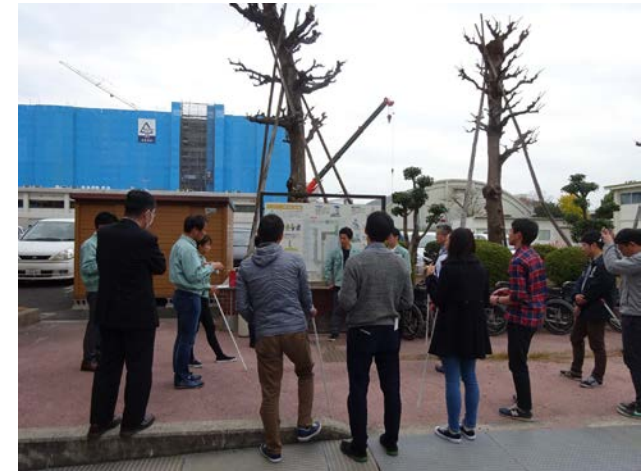
県内の自治体（都市部局）職員の方も多く見学されました。