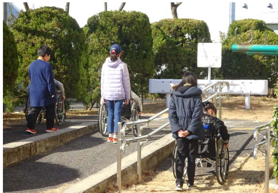
3種類（5%～12%）の勾配を体感できます