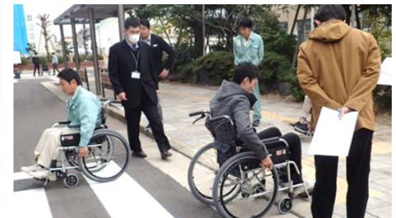
2cmの段差を上げるにはコツが必要