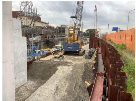
⑦荒尾地区道路 (起点→終点)