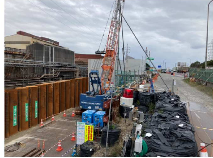
⑥荒尾IC北地区 (起点→終点)