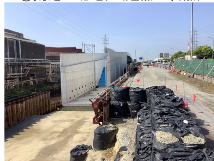
⑥荒尾IC北地区(起点→終点)