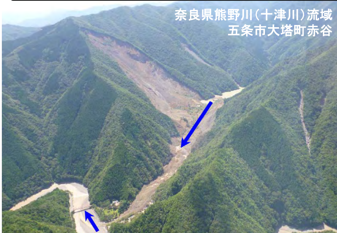
奈良県熊野川(十津川)流域 五条市大塔町赤谷

○奈良県熊野川(十津川)流域の河道閉塞は、閉塞高さ約120mと奈良県内で最大規模。