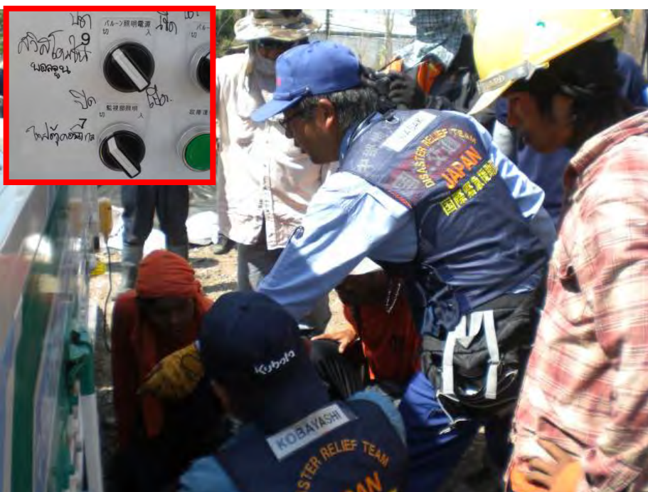
国交省職員による現地作業員への技術指導 (左上は排水ポンプにタイ語で記載した操作説明)