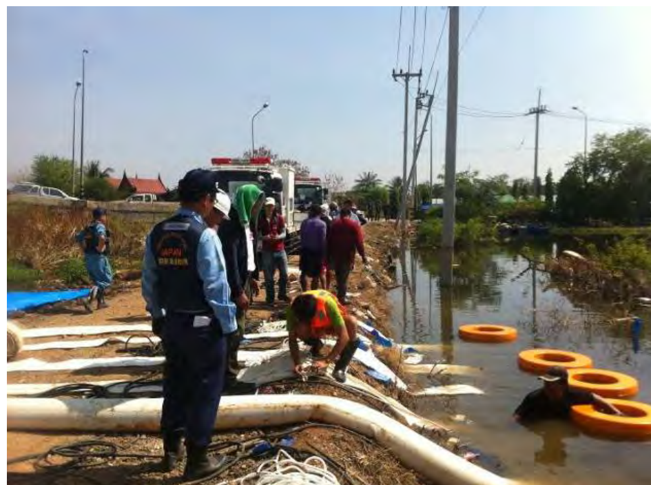
国交省職員の指導に従い排水ポンプを設置する現地作業員