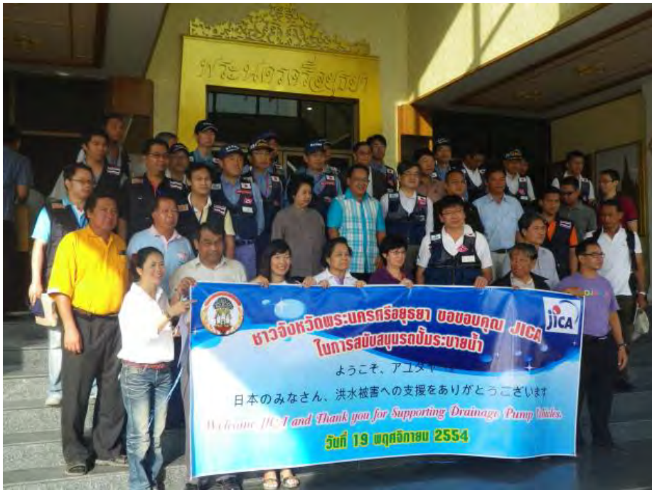
アユタヤ県における到着記念式典

○排水作業は3班体制で行われ、国土交通省職員は現地班長としてポンプの設営・運転管理・撤去にかかる技術的指導・助言等を担当。