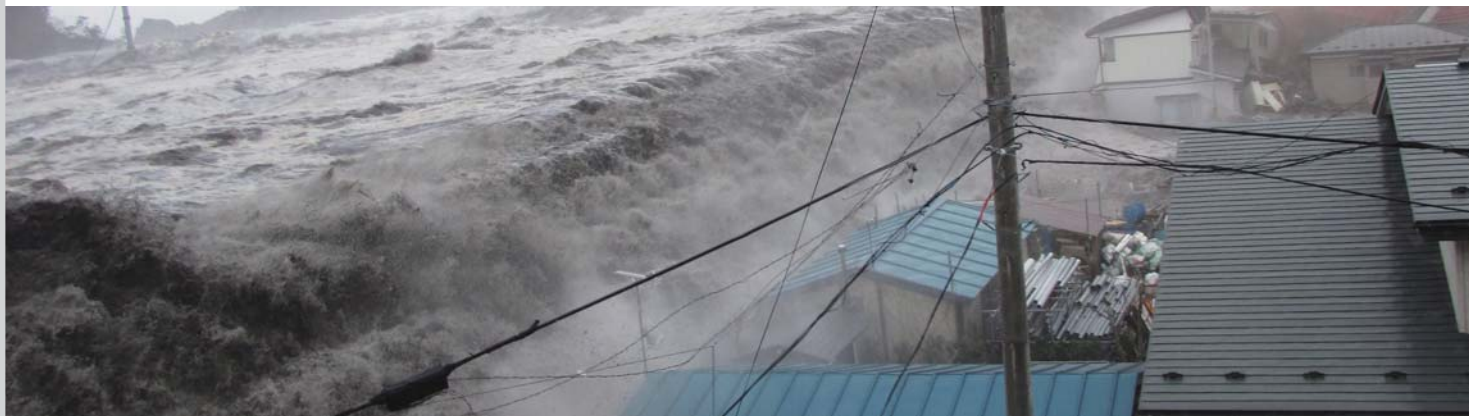
岩手県宮古市(旧田老町) 田老町漁業協同組合提供資料

斜面を遡上した高さでは、岩手県宮古市で39m以上を記録。これは1896年の明治三陸地震の際、岩手県大船渡市で確認された38.2mを上回る、観測史上最大の規模となった。