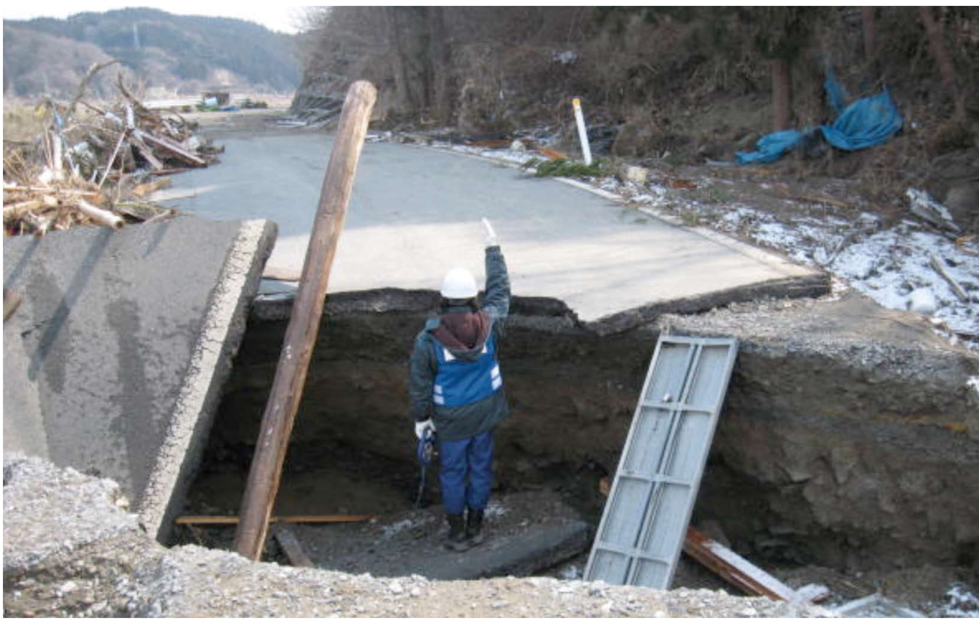
気仙川右岸側の県道被災状況調査(岩手県)

TEC-FORCE（緊急災害対策派遣隊）は、大規模自然災害が発生、または発生するおそれがある場合に、地方公共団体等が行う被災状況の迅速な把握や早期復旧に関する技術的支援を行います。災害規模、発生場所等に応じて複数の地方整備局・国道事務所等から出動。