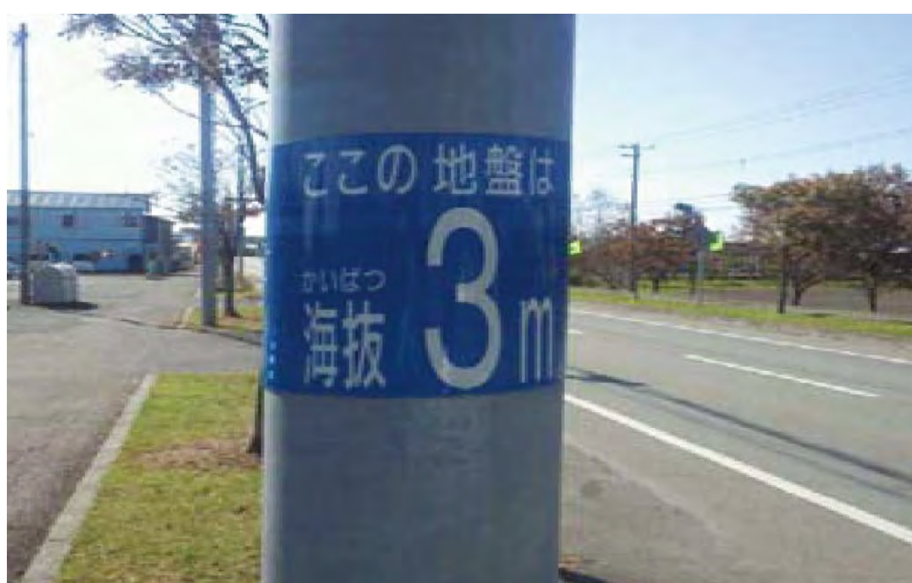
国道236号浦河町西幌別