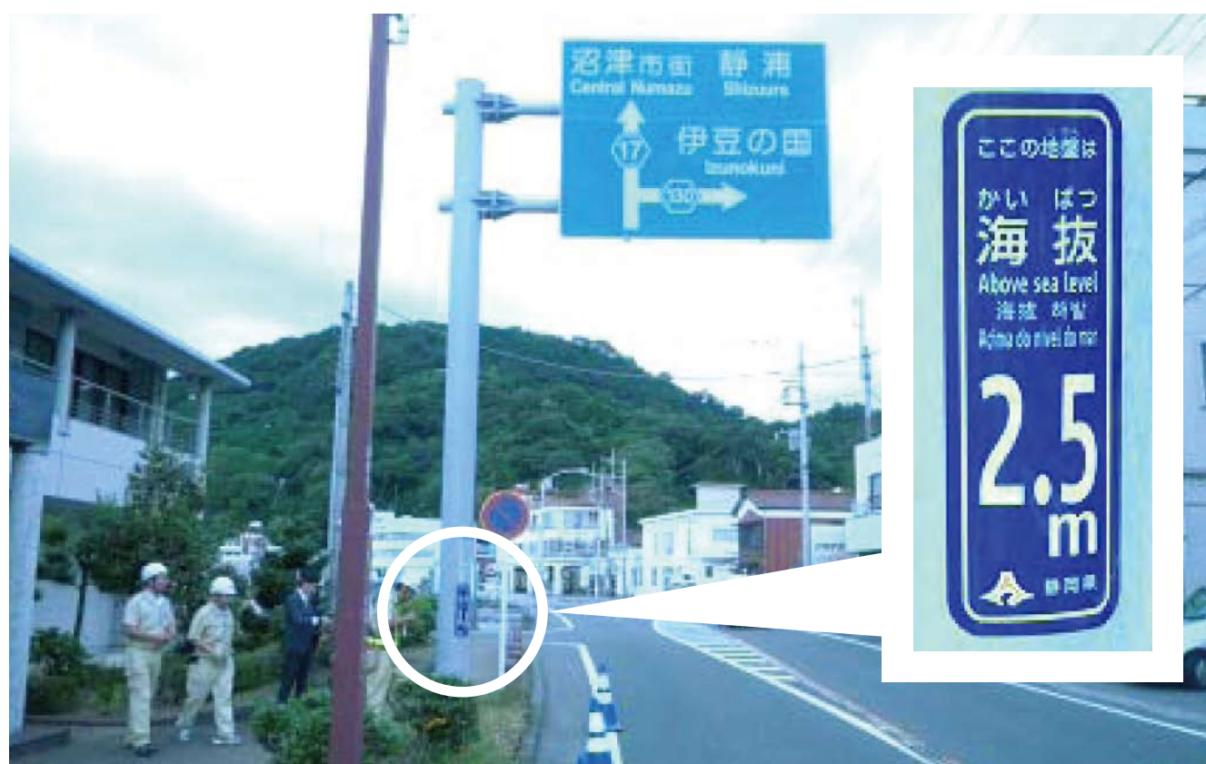
県道沼津土肥線：沼津市立静浦東小学校付近