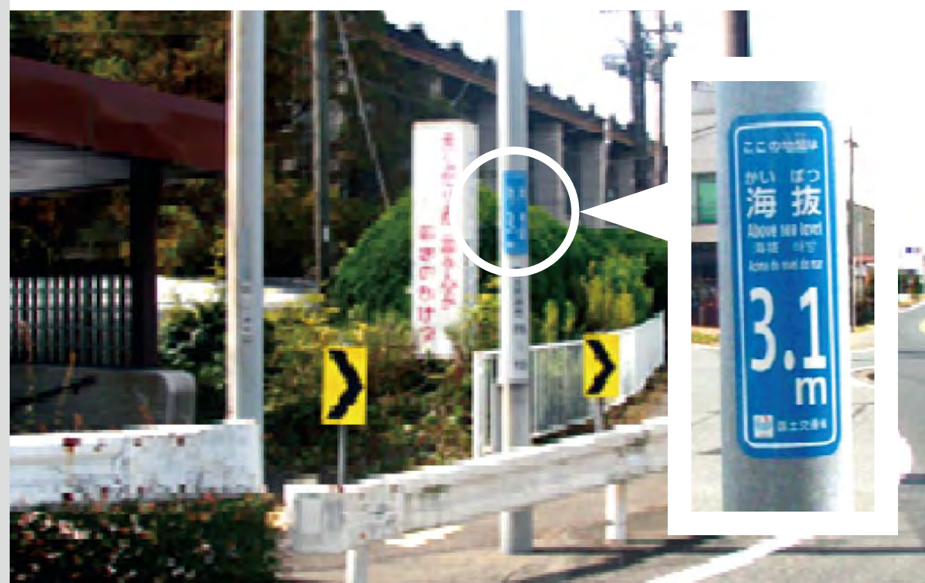
国道1号新居支所前交差点付近

道路の標識柱に、青色の海拔表示シートを設置しています。歩行者やドライバーの目線の高さに配慮して、路面から1.5m程度の位置に貼り付けました。平常時に道路や周辺の高さを知り、避難時には安全か否かの目安になります。これは、県市とも連携し、国道の他に主要地方道の標識柱や信号柱にも設置されます。