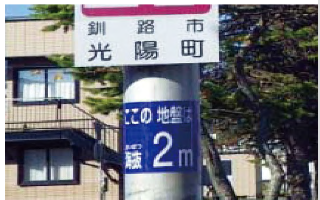
主要地方道釧路環状線釧路市光陽町