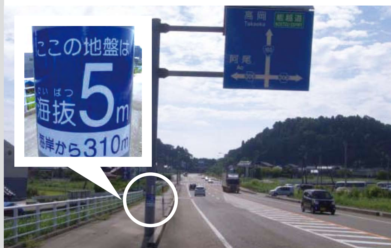
国道160号氷見市海峰小学校口交差点付近