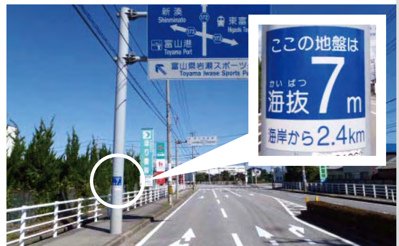
県道八幡田稲荷線富山市東富山駅前交差点付近