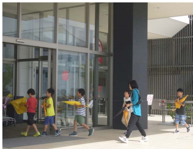
小学校からショッピングセンターへの避難訓練の様子