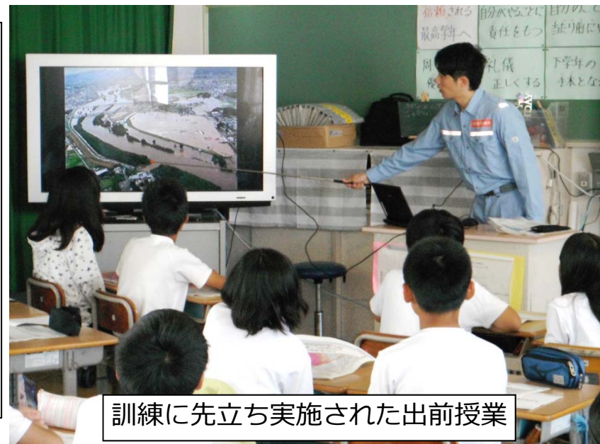
訓練に先立ち実施された出前授業

○授業では、東海豪雨(2000年9月)の実際の映像を見て、大きな洪水が身近に起こることを実感した。