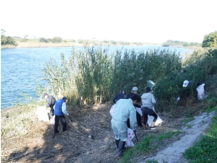
水際のゴミを集める参加のみなさま