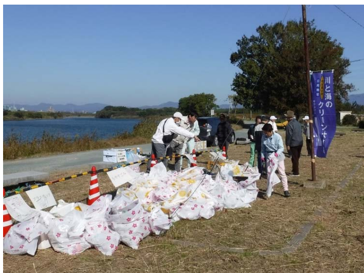
多くのゴミが回収され豊川が美しくなりました。