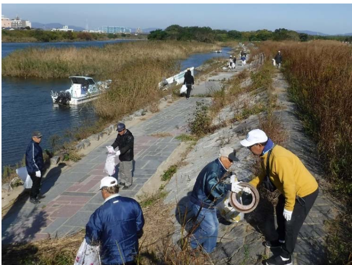
参加者の協力により回収作業がされました