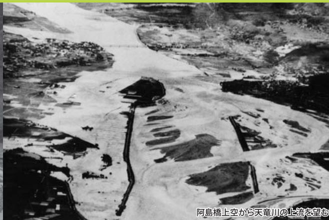
阿島橋上空から天竜川の上流を望む