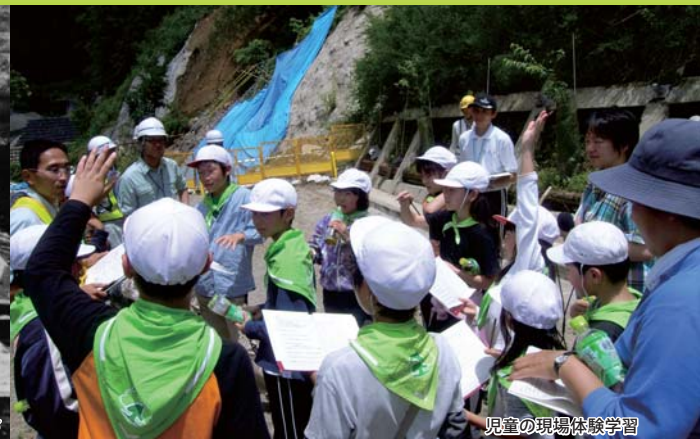
児童の現場体験学習