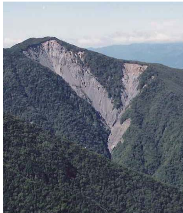
小渋川の流出土砂量の大半を生産しているとされる大崩壊地