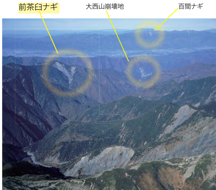
荒川岳から見た前茶臼ナギ 遠くには大西山崩壊地や百間ナギが見える

小渋川上流上沢に位置する前茶臼山東側に広がる崩壊地。 前茶臼山断層に関連して、崩壊が生じている。地質的には秩父帯でジュラ紀の緑色岩・チャート・砂岩・泥岩の互層により構成されており、1898(明治31)年及び1929(昭和4)年に大災害が発生したと伝えられている。