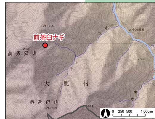
(国土地理院の数値地図25000(地図画像)を使用)

ナギとは山をナギ落としたような崩壊地のこと。 1898(明治31)年7月に前茶臼山の斜面が大崩壊した。上沢直下にあった小渋湯温泉が被災し、死者10名にのぼる被害が発生した。