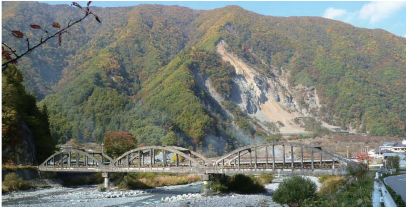
橋の後方に見える大西山崩壊地が災害の爪跡を物語っている

三六災害の際に発生した大西山の大崩壊は、42名の命を奪った。 三六災害で一帯が賽の河原と化した中で、変わらぬ姿で架かっていた3連アーチの橋。 アーチと桁側面のへこみがしっかりと造られ、コンクリート橋の外観を引き締めている。 2011(平成23)年に国の登録有形文化財に登録され、信濃の橋百選に選定されている。