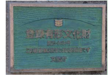
登録有形文化財に指定されている