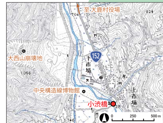
(国土地理院の数値地図25000(地図画像)を使用)