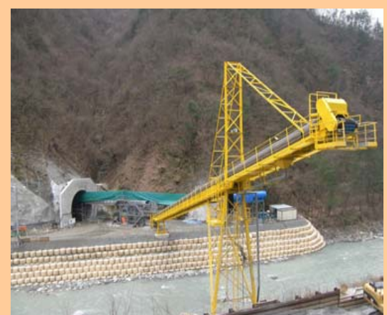
ベルトコンベア橋設置 (残土運搬用ベルトコンベア)

入谷地すべりF1ブロック対策工事が一月より、いよいよ本格的に始まります 大鹿村、村民の方々にはご迷惑をおかけしますが、よろしくお願いいたします 尚、お気づきのてんがございましたら、下記までご連絡ください