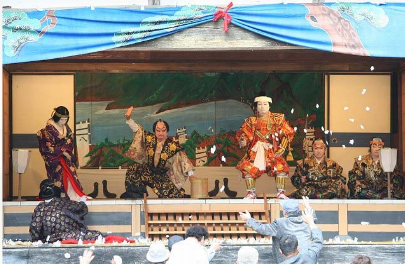
1000人を超える観客は、昔ながらの観劇スタイルで、歌舞伎を楽しんでいました