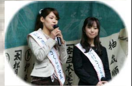
大鹿村さくらの女王